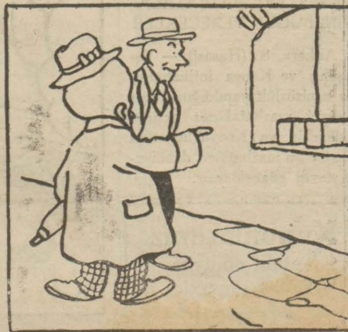
2. Hasan Bey — Bu, Mutbâk ocağıdır, buradan yemek çıkar.