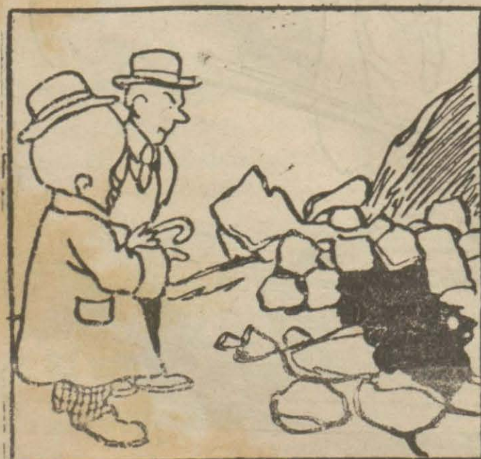
1. Hasan Bey — Bu Taş ocağıdır, buradan taş çıkar.