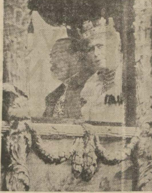
Konferansı açmaya giden Kıral ve Kıraliçe