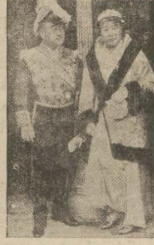
Konferanstan sonra verilen Büyük resmi kabulde hazır bulunan Japon sefiri ve refikası