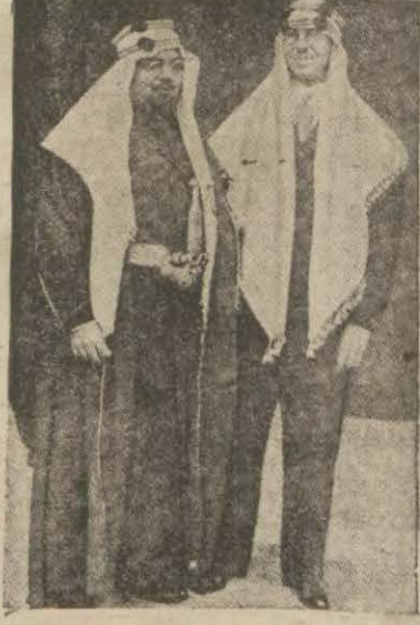
Konferanstan sonra verilen büyük resmi kabulde Hiçaz sefiri