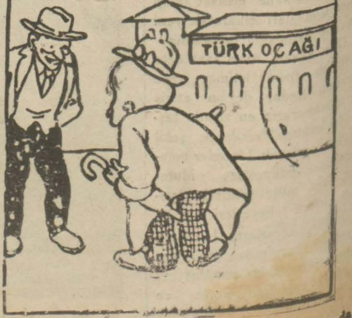
4. Hasan Bey — Bu, Türk ocağıdır, buradan da para çıkar.