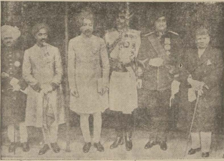
Konferansa iştirak eden Hint mihraceleri

Londrada toplanan imparatorluk konferansı nihayet işini bitirdi.