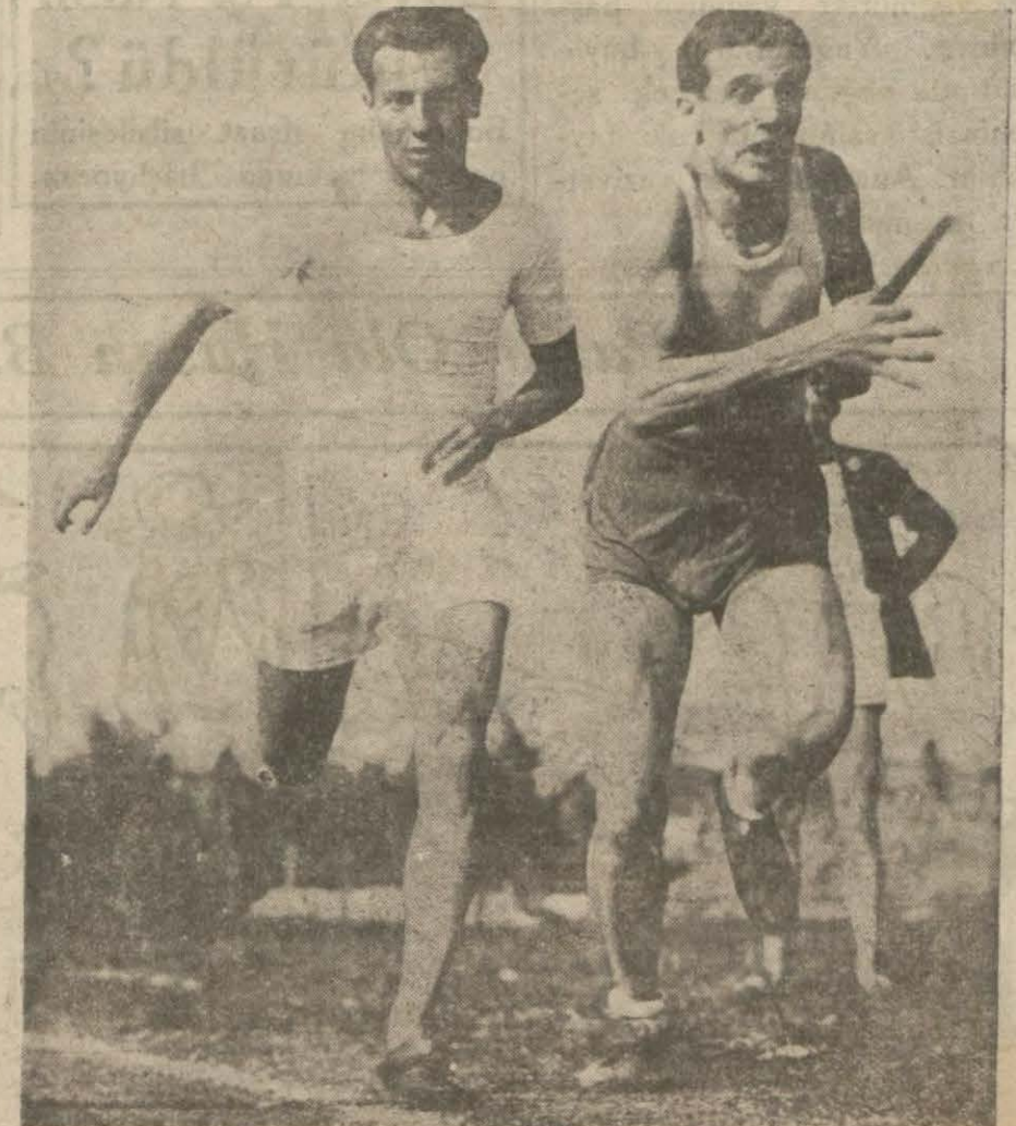
Koşu Sonlarına Doğru Heyecanlı Bir an.. [ Spor haberlerimiz 2 inci ve 4 üncü sayfalarımızdadır ]